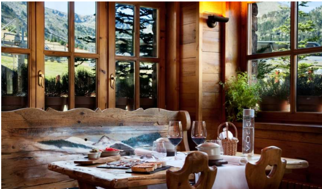
Restaurante Vaqueria. Hotel Grau Roig