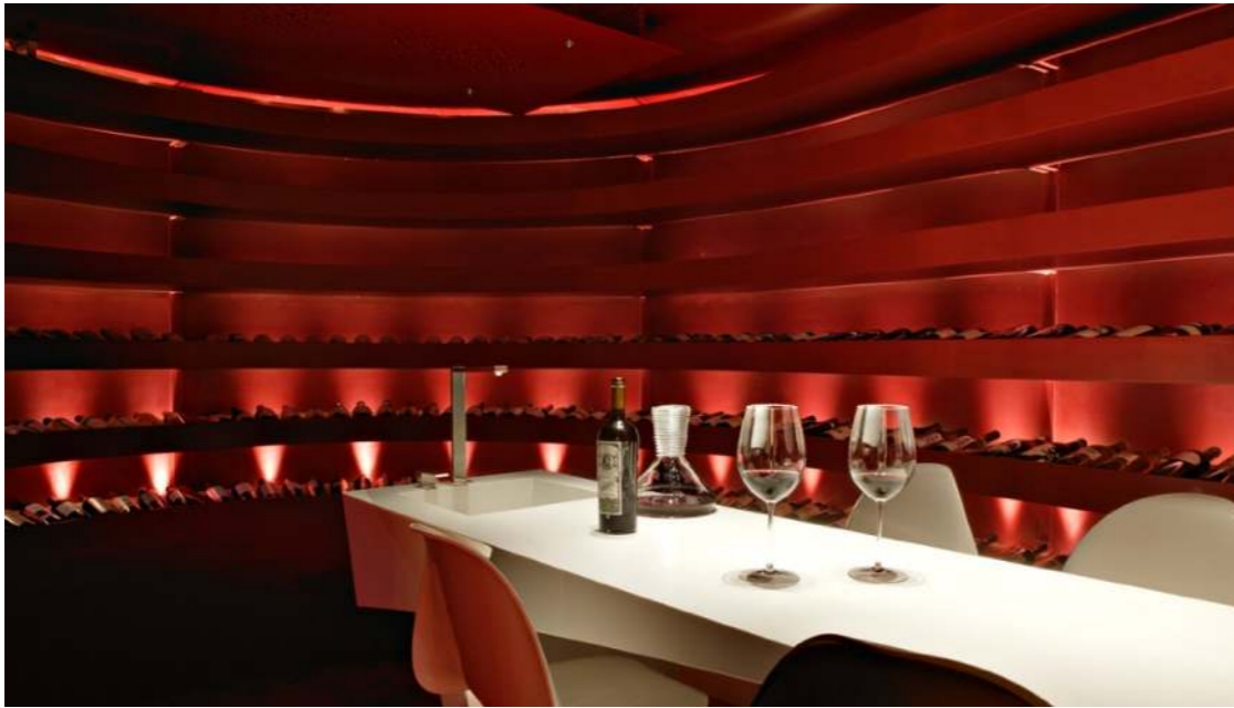
Teatro del Vino. Hotel Grau Roig