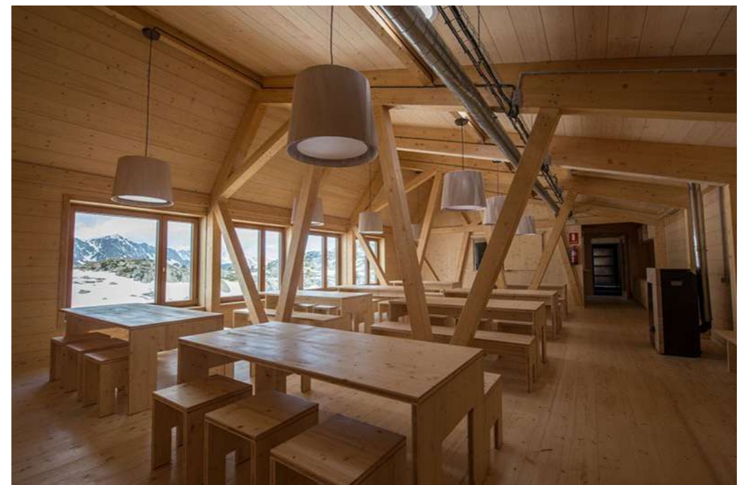
Refugio l' Illa