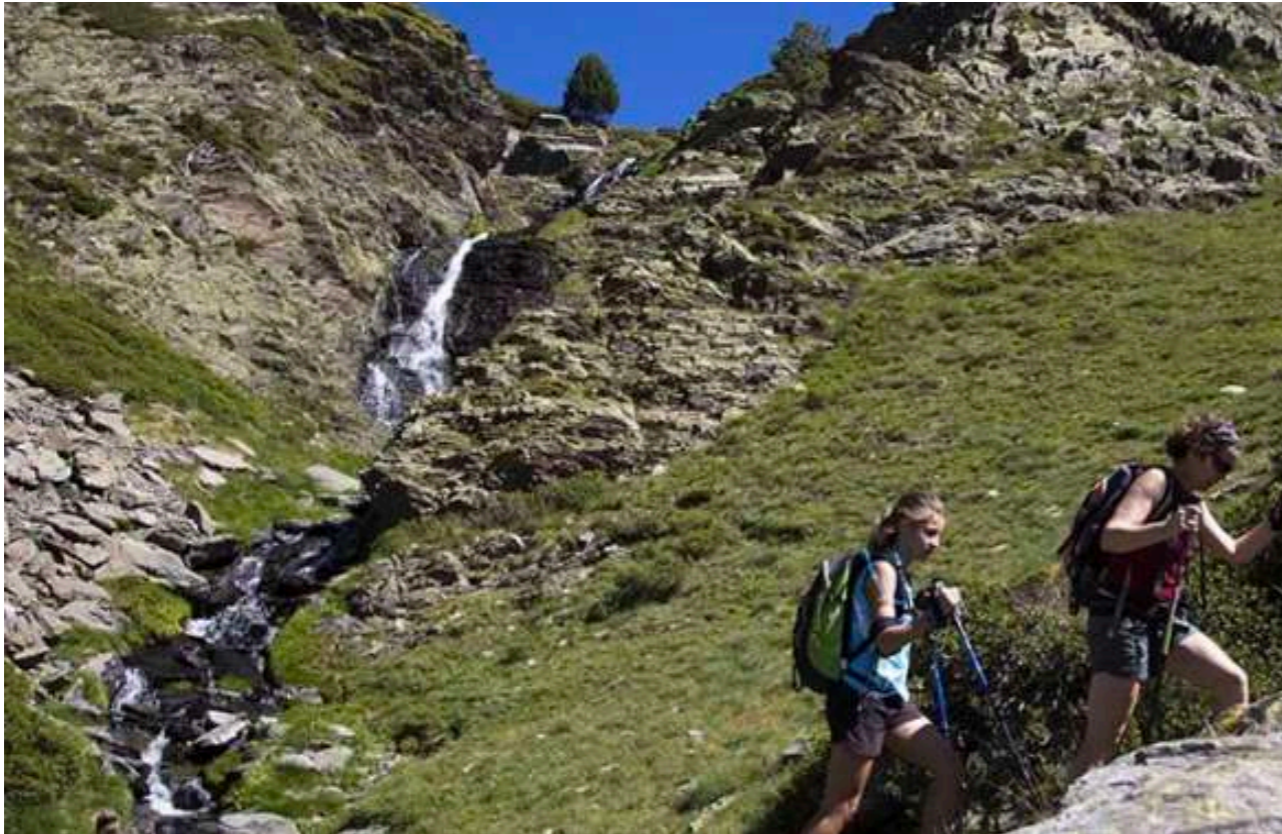
Imágenes de la Ruta.